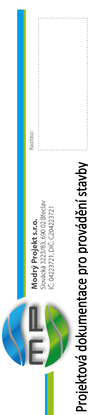
Projektová dokumentace pro provádění stavby

TATO PROJEKTOVÁ DOKUMENTACE, ANI JEJÍ ČÁST NESLŮŽÍ JAKO DODATEK ANI DÍLENSKÁ DOKUMENTACE!